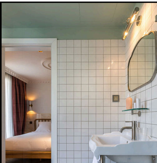
Le Rose Bourbon, 53 rue de l'Église, 75015 Paris

Le Rose Bourbon : situé rive gauche, ce 4 étoiles fraîchement inauguré multiplie les détails graphiques. Plus précisément, tout ici - bois naturel, marbre, faïence, velours mat et touches d'inox brossé - célèbre le style Art Deco, des chambres au lobby en passant par le bar. Mention très bien au copieux petit-déjeuner (les viennoiseries sont juste parfaites) servi au sous-sol autour d'une charmante cuisine, ouverte et vitrée. A partir de 190 euros la nuit. 53 rue de l'Église, 75015 Paris.