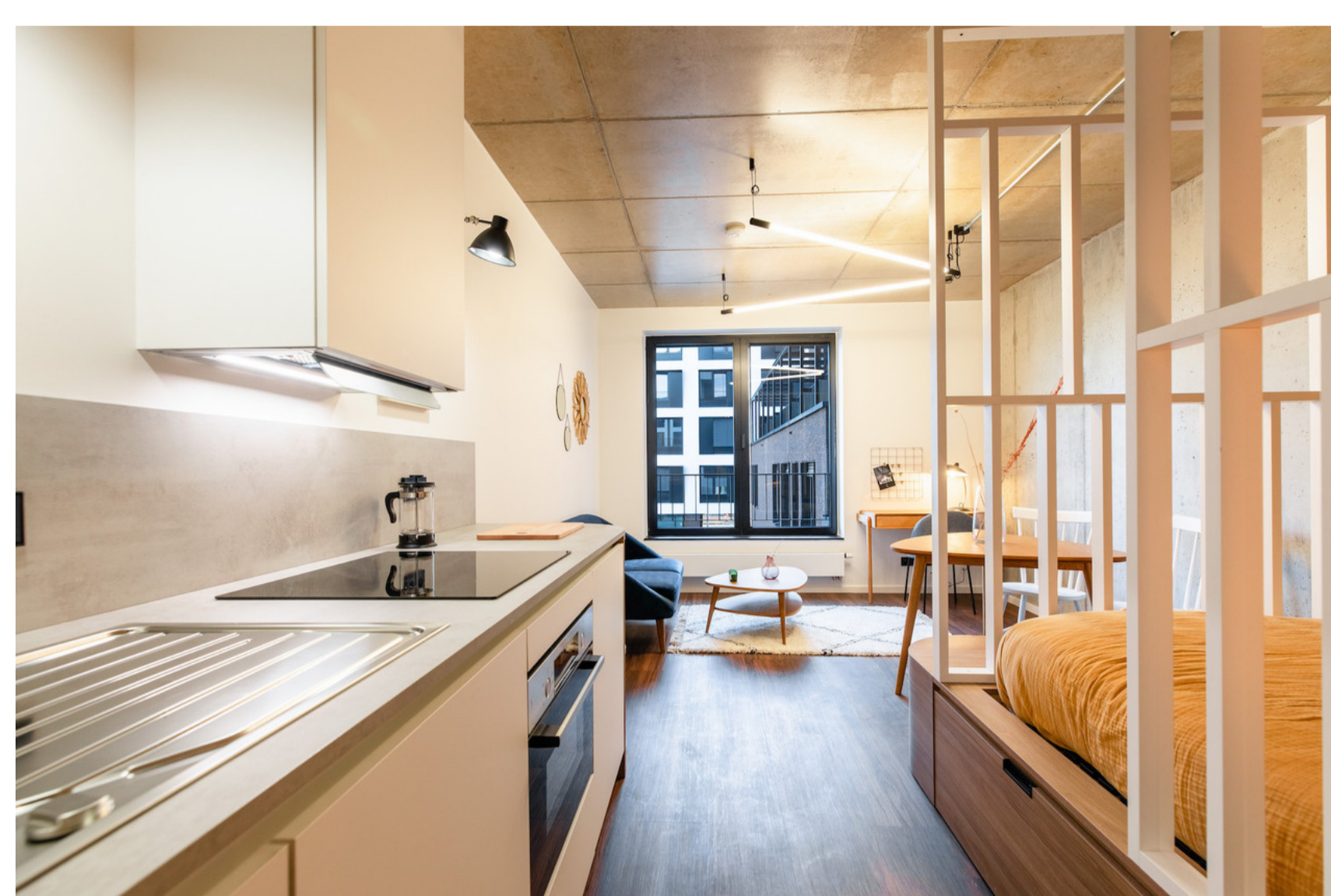
L'aménagement intérieur des studios a été confié au bureau d'architectes EL'LE.

Pour répondre à la forte demande de logements de petite taille et flexibles, Cocoonut avait développé le coliving. La start-up se lance désormais dans la location flexible de studios meublés, avec une nouvelle offre dans l'immeuble neuf Postel à Belval.