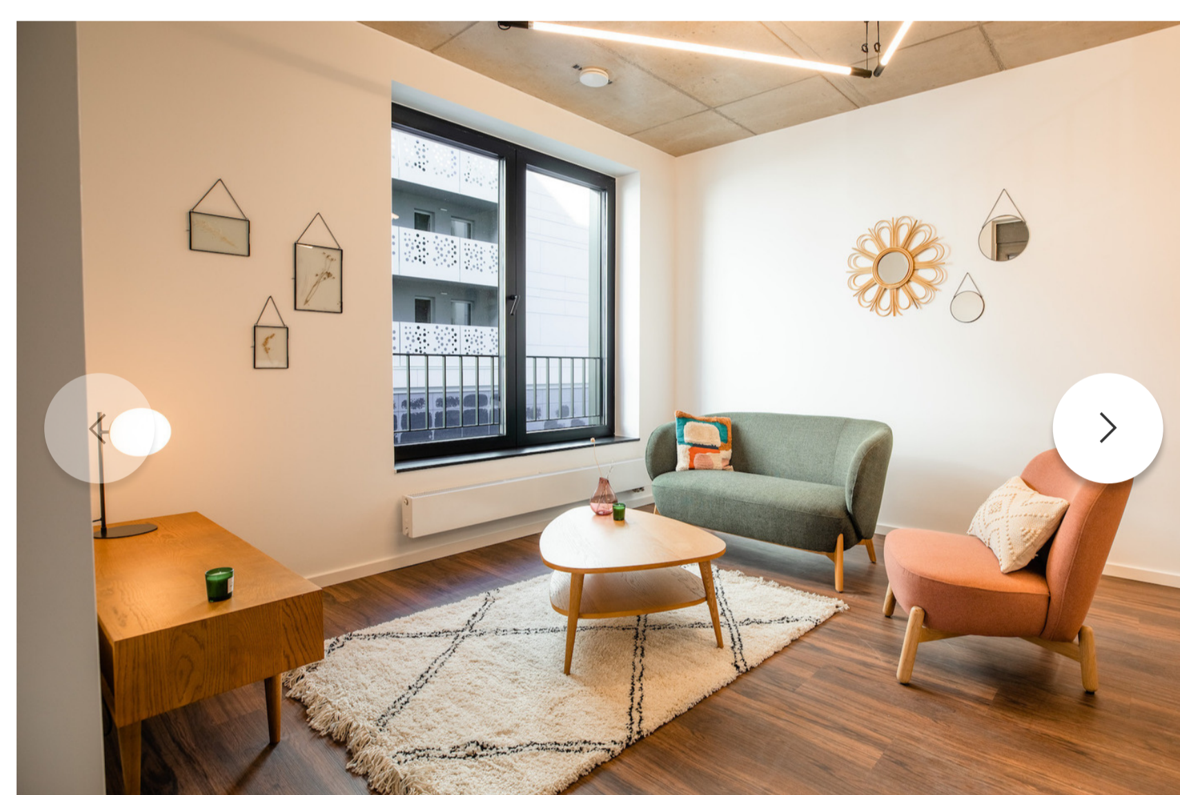
Décoration soignée, coin pour faire du home working, tout est prévu pour rendre le logement adéquat à la demande actuelle.