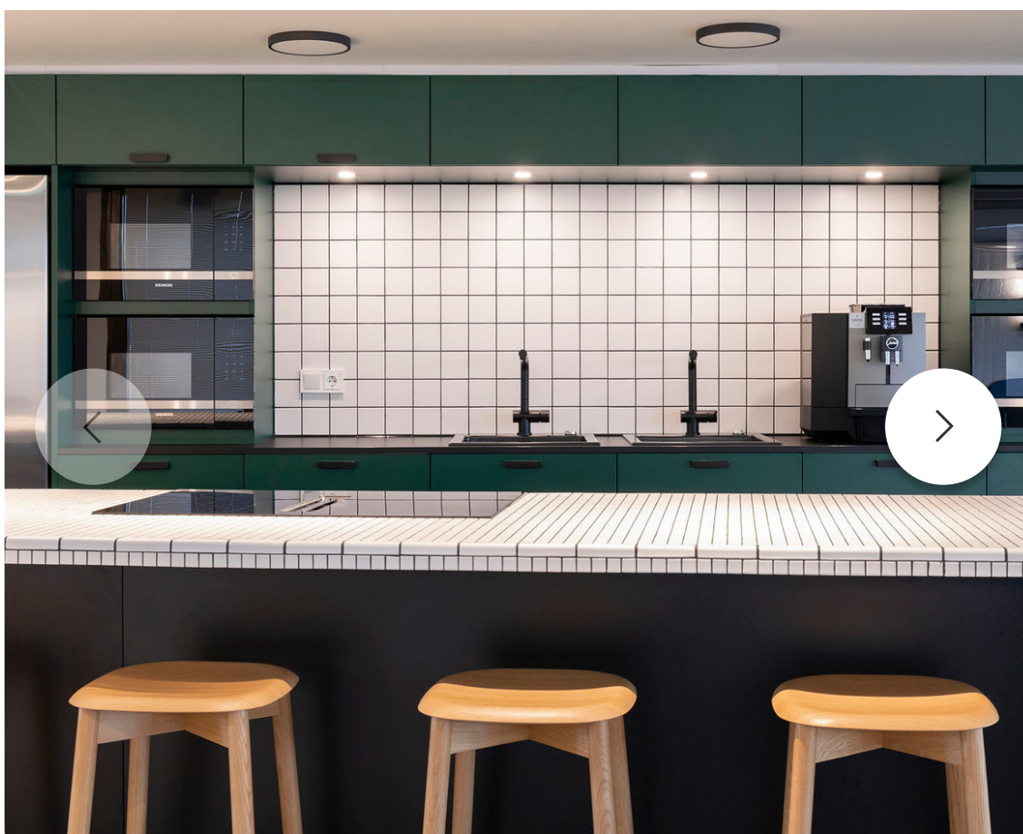
Une nouvelle cuisine aménagée est à la disposition des équipes.

Au rez-de-chaussée, les châssis en bois mis en œuvre lors de la précédente intervention par le bureau Valentiny hvp architects ont été conservés et mis en valeur par l'apport d'une structure en bois moderne et légère qui permet, par un jeu de pivot, d'ouvrir ou de fermer visuellement l'espace.